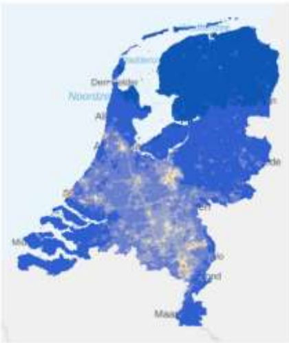
Emissies van fijnstof in Nederland, 2019. De kaart is gemaakt door het RIVM (blauw is weinig, rood is veel emissie)