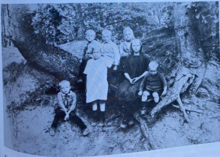
Kinderen op de Heuveltjes, tegenover de Viskom.