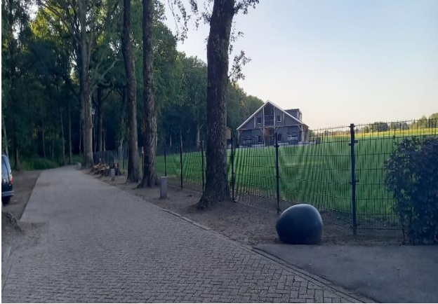
vandaag 22-08-2022