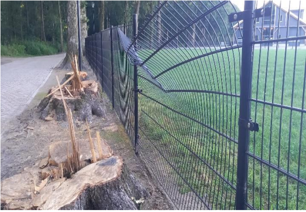
vandaag 22-08-2022